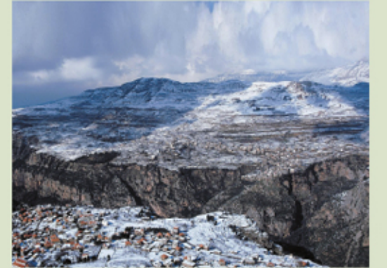
منظر عام لبشري

سُميت بشري في الفترة الصليبية بوسيرا و كانت جزءاً من كونتية طرابلس. في الحقبة المملوكية لعب مقدمي بشري دوراً هاماً. المقدمون أو المقدمة هو مصطلح يدل على رتبة